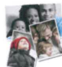
Photos, dessins d'enfants