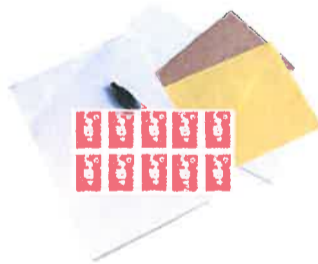
Nécessaire de courrier

Emballer les aliments dans des boîtes en plastique transparent ou des sachets plastiques (type sachets de congélation) fermés avec des élastiques ou des liens sans métal