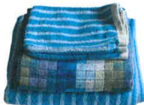
Linge de toilette