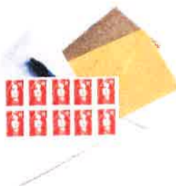
Nécessaire de courrier

Emballer les aliments dans des boîtes en plastique transparent ou des sachets plastiques (type sachets de congélation) fermés avec des élastiques ou des liens sans métal