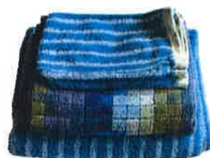
Linge de toilette