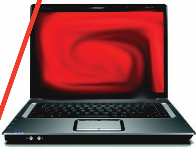
Téléphones portables, matériel informatique : ordinateur, clé USB, MP3, clé 3G, etc.