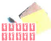
Nécessaire de courrier

Emballer les aliments dans des boîtes en plastique transparent ou des sachets plastiques (type sachets de congélation) fermés avec des élastiques ou des liens sans métal