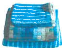
Linge de toilette