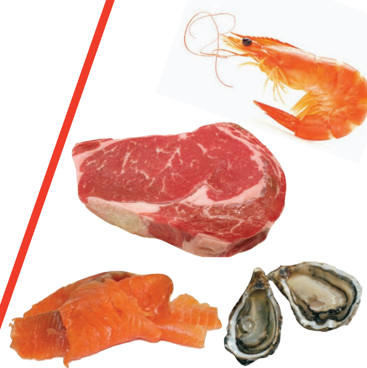
Produits dont la conservation est délicate