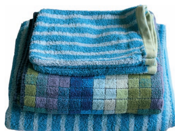
Linge de toilette