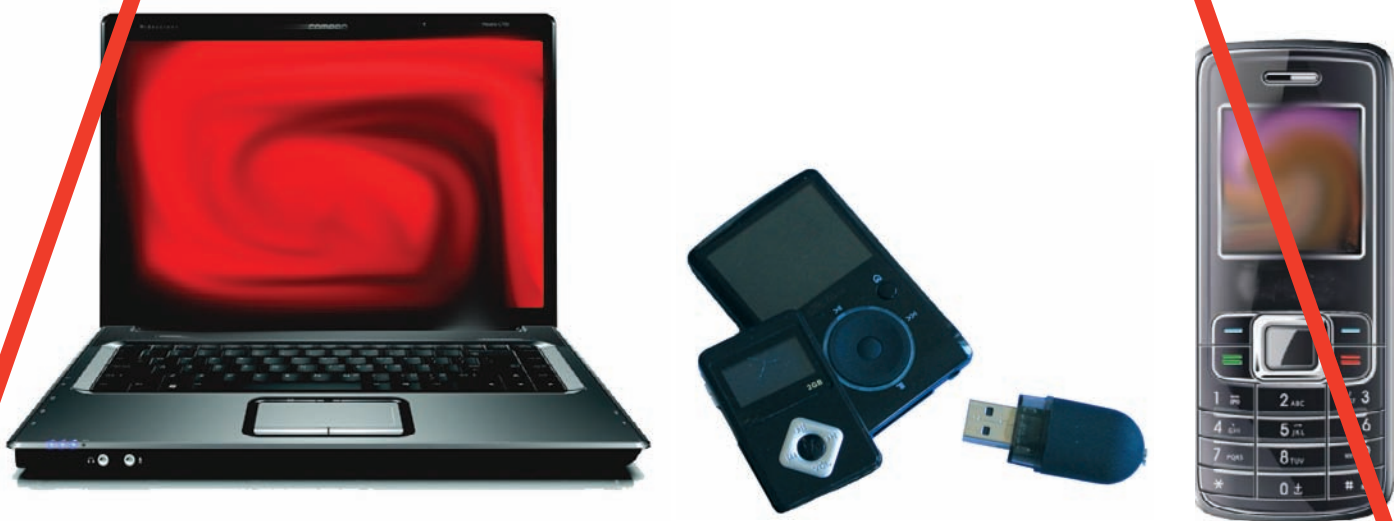
Téléphones portables, matériel informatique : ordinateur, clé USB, MP3, clé 3G, etc.