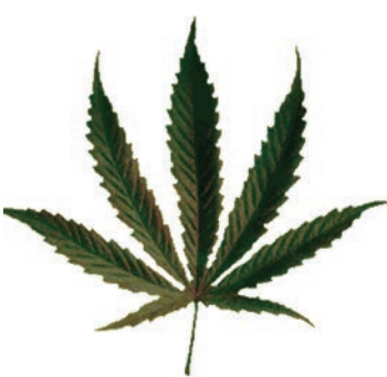
Médicaments, seringues, stupéfiants, tabac