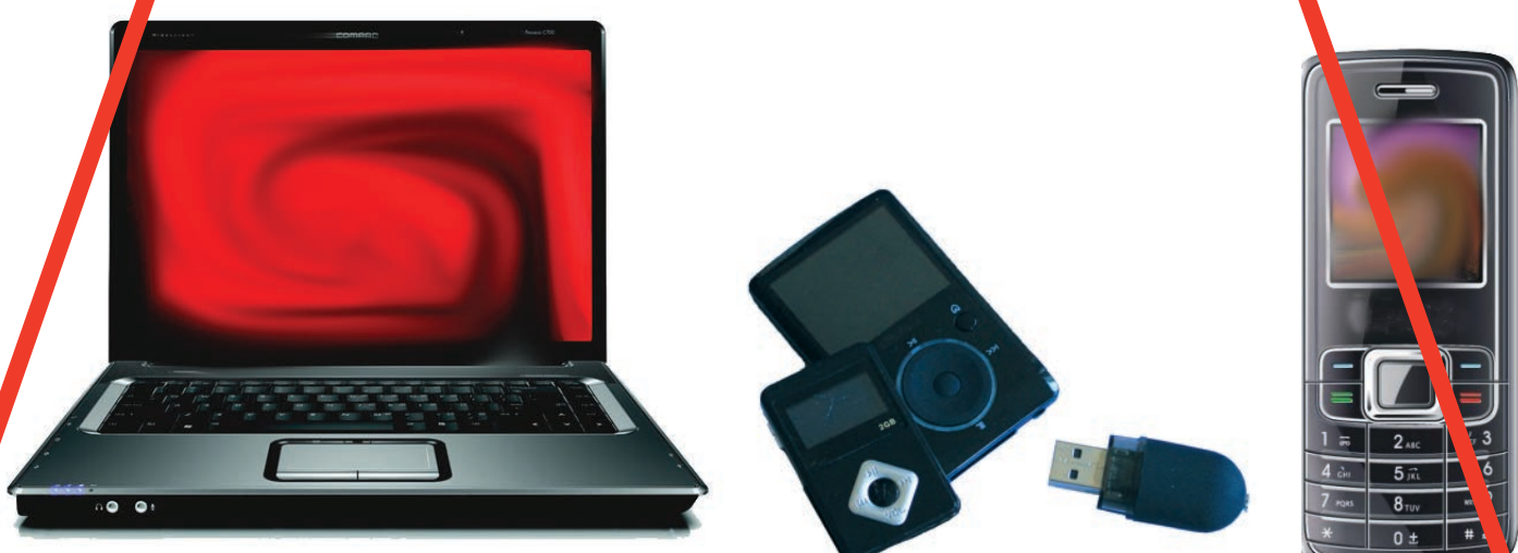
Téléphones portables, matériel informatique : ordinateur, clé USB, MP3, clé 3G, etc.

Le poids total du colis ( transmis exclusivement en un seul paquet ) ne doit pas dépasser 5 kg.