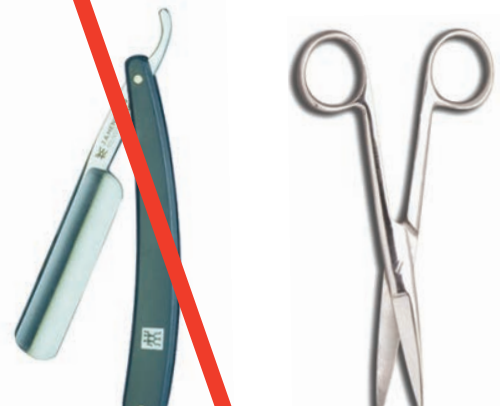
Armes, objets tranchants ou coupants