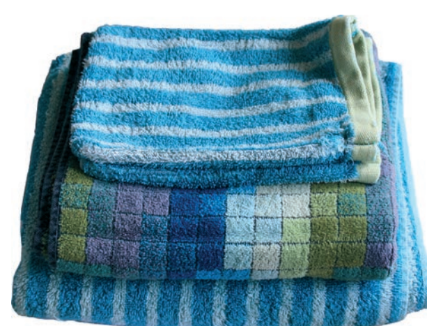
Linge de toilette