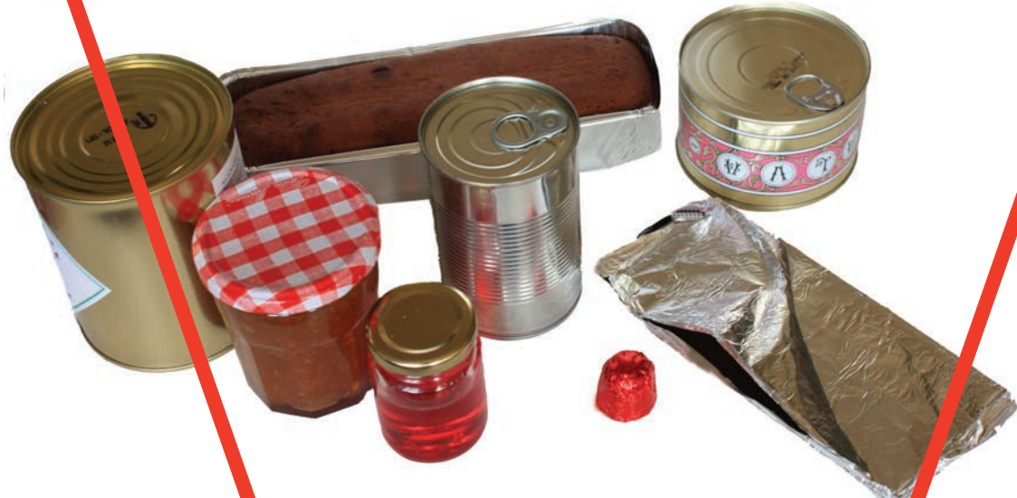
Emballages en aluminium, liens métalliques, récipients en métal, bocaux en verre