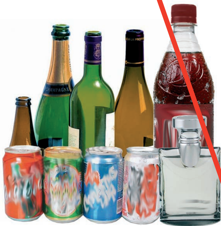
L'alcool (y compris dans les plats cuisinés) et tous les liquides (y compris les eaux de toilette)