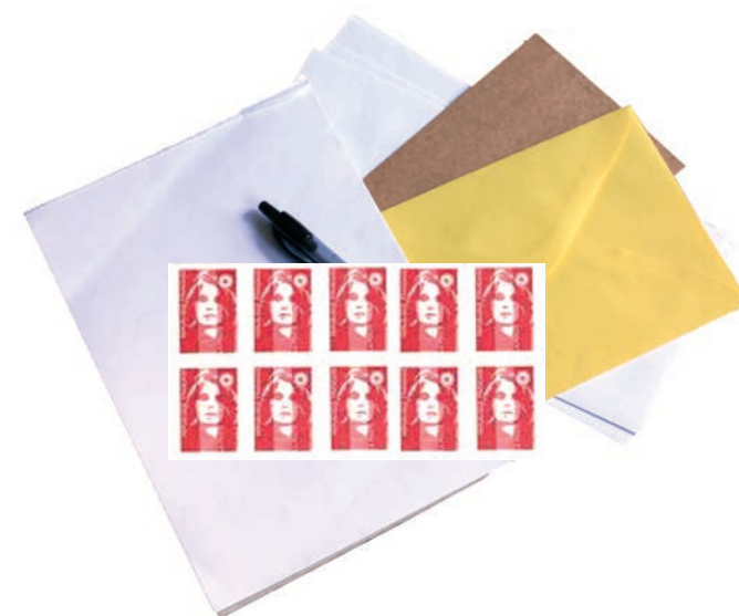
Nécessaire de courrier

Emballer les aliments dans des boîtes en plastique transparent ou des sachets plastiques (type sachets de congélation) fermés avec des élastiques ou des liens sans métal