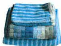
Linge de toilette