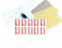
Nécessaire de courrier

Emballer les aliments dans des boîtes en plastique transparent ou des sachets plastiques (type sachets de congélation) fermés avec des élastiques ou des liens sans métal