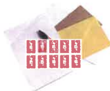
Nécessaire de courrier

Emballer les aliments dans des boîtes en plastique transparent ou des sachets plastiques (type sachets de congélation) fermés avec des élastiques ou des liens sans métal