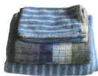
Linge de toilette