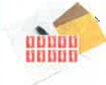
Nécessaire de courrier

Emballer les aliments dans des boîtes en plastique transparent ou des sachets plastiques (type sachets de congélation) fermés avec des élastiques ou des liens sans métal