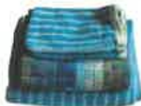
Linge de toilette