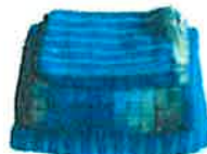
Linge de toilette