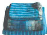
Linge de toilette