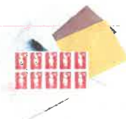
Nécessaire de courrier

Emballer les aliments dans des boîtes en plastique transparent ou des sachets plastiques (type sachets de congélation) fermés avec des élastiques ou des liens sans métal