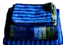
Linge de toilette