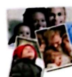
Photos, dessins d'enfants