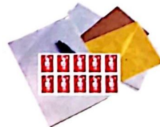
Nécessaire de courrier

Emballer les aliments dans des boîtes en plastique transparent ou des sachets plastiques (type sachets de congélation) fermés avec des élastiques ou des liens sans métal